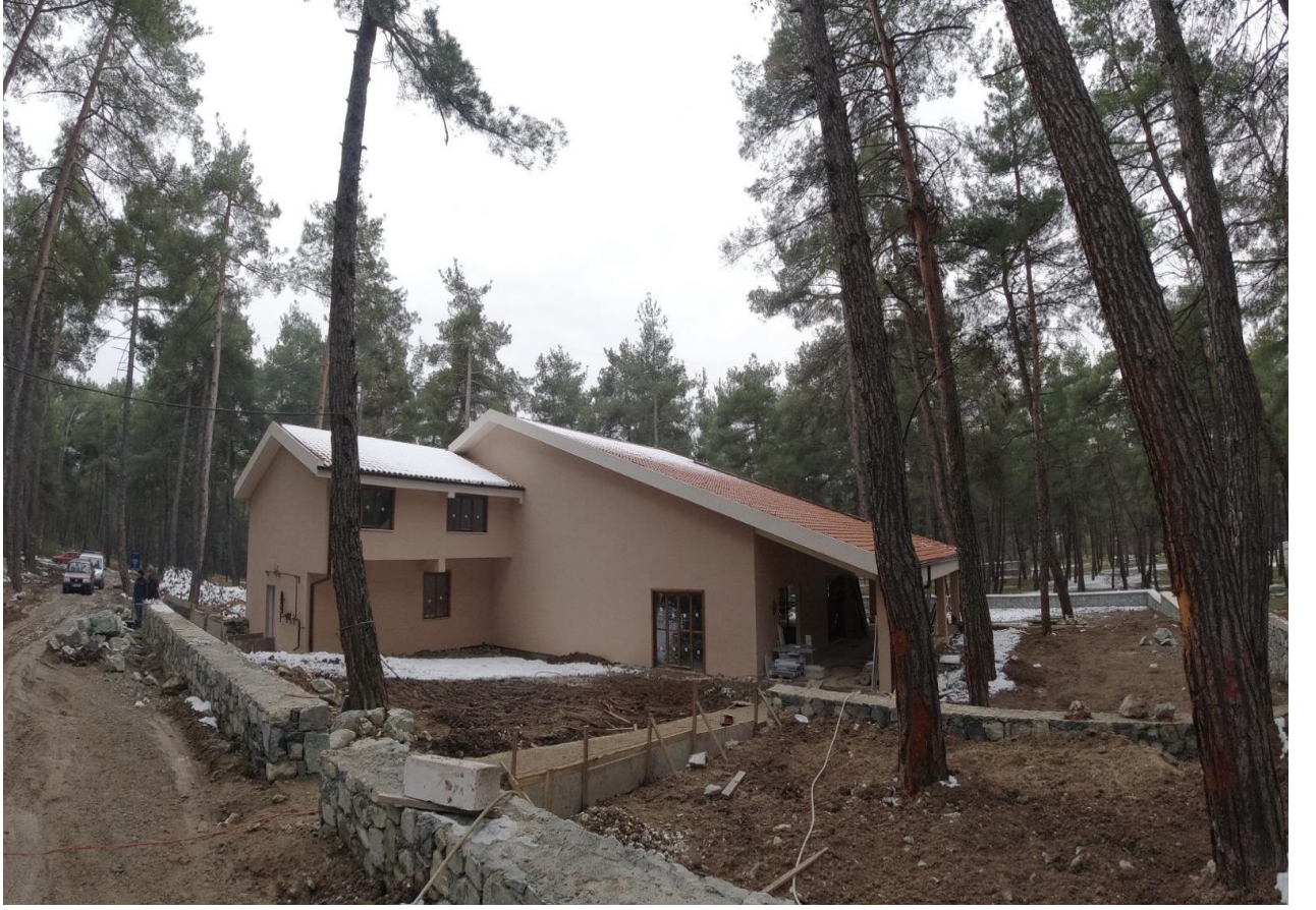
Karagöz Mesire Alanı Restoran