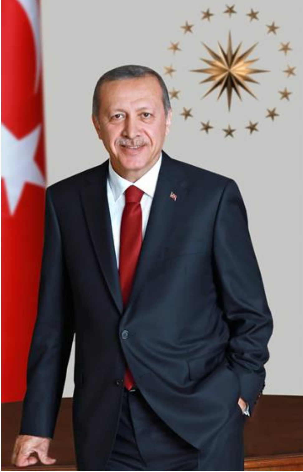
Recep Tayyip ERDOĞAN Cumhurbaşkanı