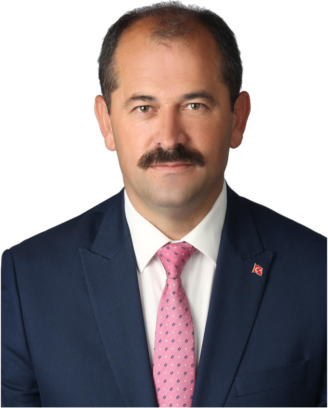
Ali AYKURT Orhaneli Belediye Başkanı