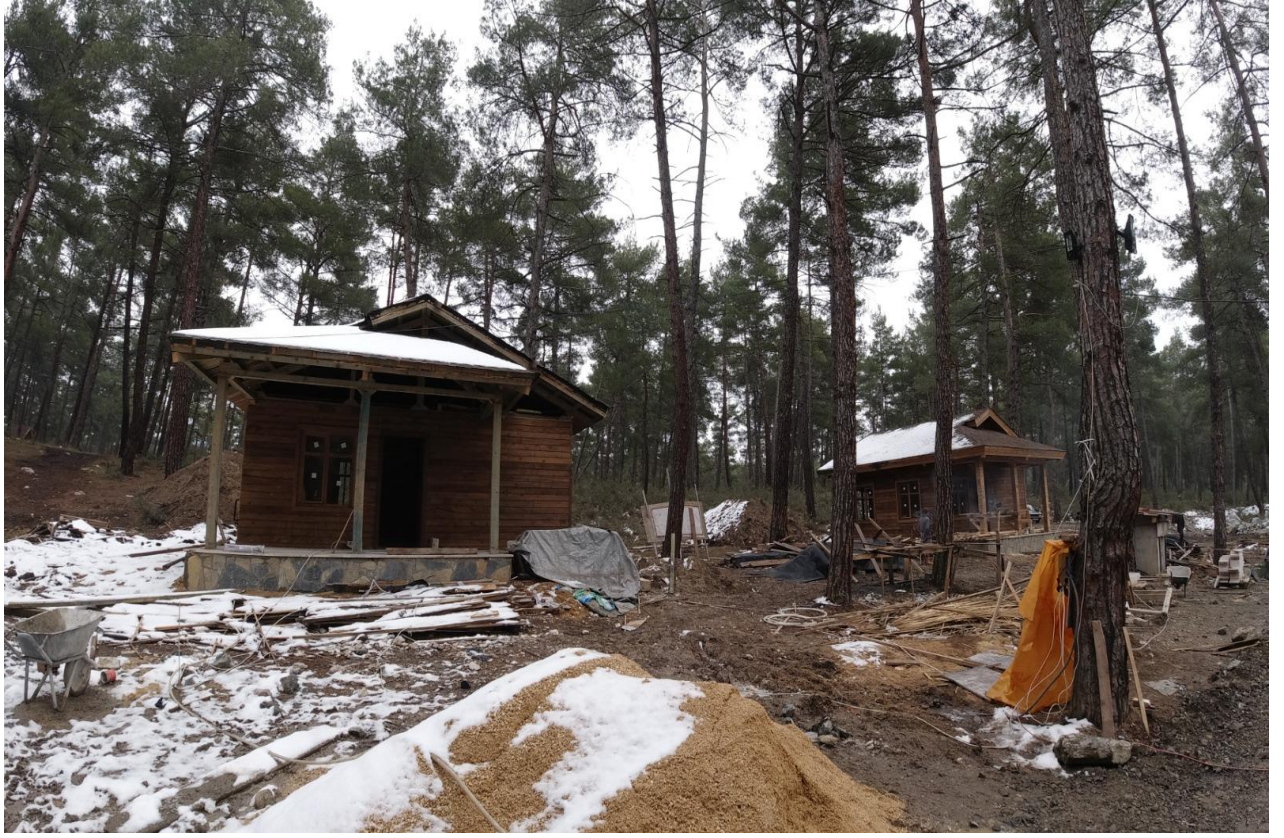
Karagöz Mesire Alanı Bungalov Evleri