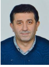
ÖZCAN YILDIRIM AK PARTİ